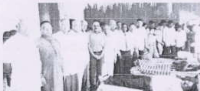
ಬೆಂಗಳೂರಿನಲ್ಲಿ ನಡೆದ ರಕ್ತದಾನ ಕಾರ್ಯಕ್ರಮದ ದೃಶ್ಯ

ರಕ್ತದಾನದಿಂದ ಮತ್ತೊಬ್ಬರ ಜೀವ ಉಳಿಸಿ. ರಕ್ತದಾನದ ಮೂಲಕ ಜೀವ ಉಳಿಸುವ ಕಾರ್ಯಕ್ರಮವನ್ನು ಜಯವಾಹಿನಿ ಪತ್ರಿಕೆ ಮತ್ತು ಬೆಂಗಳೂರಿನಲ್ಲಿ ನಡೆಸಲಾಯಿತು. ಈ ಕಾರ್ಯಕ್ರಮದಲ್ಲಿ ಹಲವಾರು ವಿದ್ಯಾರ್ಥಿಗಳು ಮತ್ತು ಸಾರ್ವಜನಿಕರು ತಮ್ಮ ರಕ್ತವನ್ನು ದಾನಿಸಿದರು.